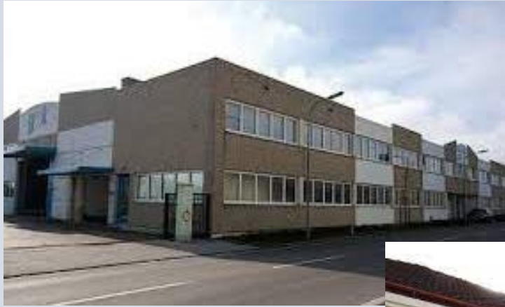
Zentrale – Leobersdorf Hirtenbergerstraße 1