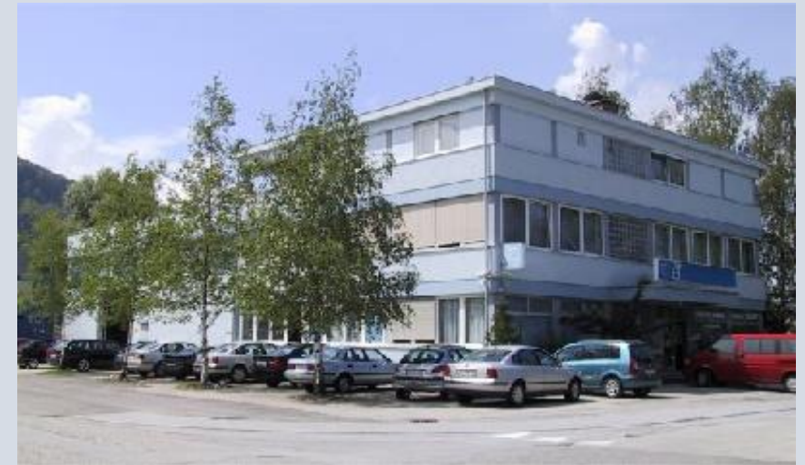
Zweigstelle – Salzburg Röcklbrunnstraße 41